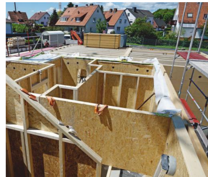
Der Holzhausbau ist ein Schwerpunkt dieses Kurses.