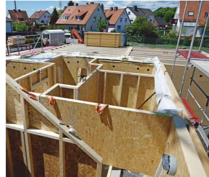
Der Holzhausbau ist ein Schwerpunkt dieses Kurses.