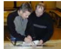
Anreißen kniffliger Bauteile nach Computerzeichnung von Hand oder ...

Dieser Kurs ist unser seit Jahrzehnten bewährter und anerkannter "Klassiker" mit mehreren tausend zufriedenen Absolventen und einem hervorragendem Ruf bei deutschen und internationalen Holzbaubetrieben. Zusätzlich zum Meisterbrief können die Absolventen nach bestandener Meisterprüfung - bei Nachweis ausreichender Berufspraxis - das Zertifikat Zimmermeister Holzbau Deutschland anerkannt anfordern und damit ihren Abschluss aufwerten. Weitere Informationen auf: www.holzbau-deutschland.de Informationen für Meisterschüler Wer wahrgenommen werden will, muss sich abheben!