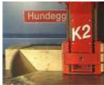
... vollautomatischer Abbund auf der Schulungs-CNC-Abbundanlage des Ausbildungszentrums.