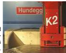
... vollautomatischer Abbund auf der Schulungs- CNC-Abbundanlage des Ausbildungszentrums.