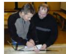
Anreißen kniffliger Bauteile nach Computerzeichnung von Hand oder ...

Dieser Kurs ist unser seit Jahrzehnten bewährter und anerkannter "Klassiker" mit mehreren tausend zufriedenen Absolventen und einem hervorragendem Ruf bei deutschen und internationalen Holzbaubetrieben. Zusätzlich zum Meisterbrief können die Absolventen nach bestandener Meisterprüfung - bei Nachweis ausreichender Berufspraxis - das Zertifikat Zimmermeister Holzbau Deutschland anerkannt anfordern und damit ihren Abschluss aufwerten. Weitere Informationen auf: www.holzbau-deutschland.de Informationen für Meisterschüler Wer wahrgenommen werden will, muss sich abheben!