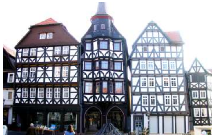
Als Restaurator bewahren Sie das großartige Erbe "alter Meister"!

im BUNDESBILDUNGSZENTRUM des Zimmerer- und Ausbaugewerbes gGmbH